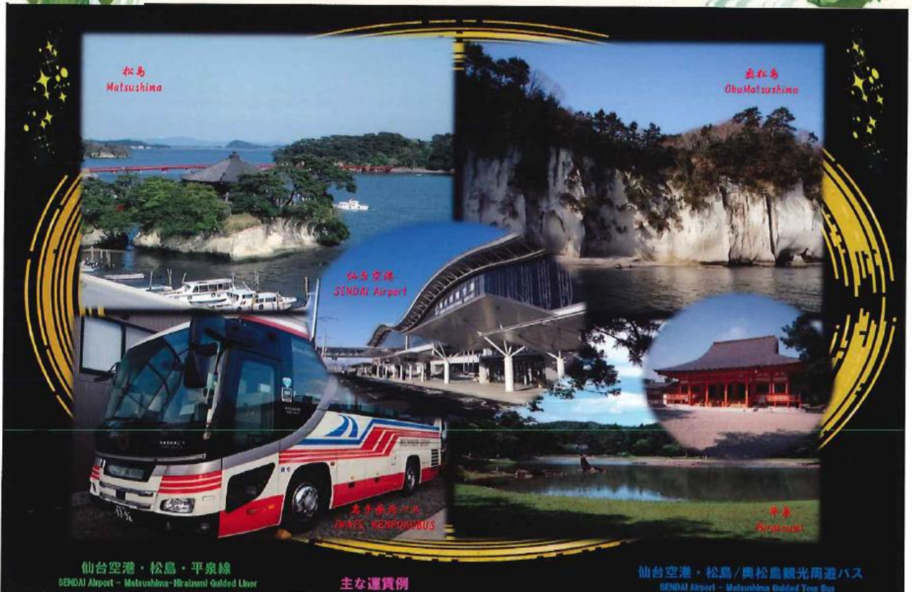
仙台空港・松島・平泉線 SENDAI Airport - Matsushima-Hiraizumi Guided Liner