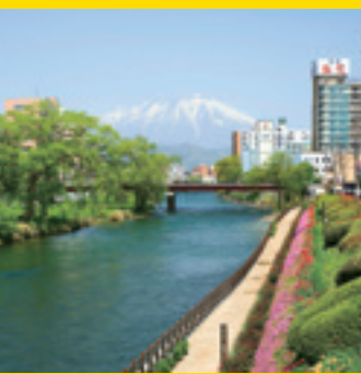
開運橋からの岩手山の眺め