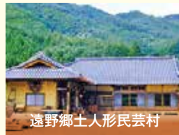
遠野郷土人形民芸村

昔話を映像や音声で楽しむ「昔話蔵」や、語り部の昔話を聞くことができる劇場「遠野座」など、見て・聞いて・食べて遠野をまるごと満喫できます。