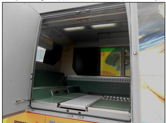
【荷台スペースの写真】