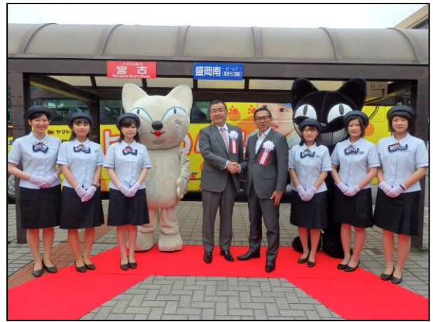
岩手県北バスのバスガイドとヤマト運輸のキャラクター「シロネコ、クロネコ」に囲まれ握手する長尾社長（中央左）と松本社長（中央右）